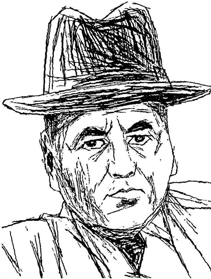
Joaquín García Monge